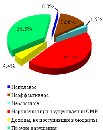
Структура финансовых нарушений выявленных Счетной палатой в 2009 году

- доходы, не поступившие в бюджеты – 13 637,7 тыс. рублей (в окружной бюджет – 904,8 тыс. рублей, в местный бюджет – 12 732,9 тыс. рублей);